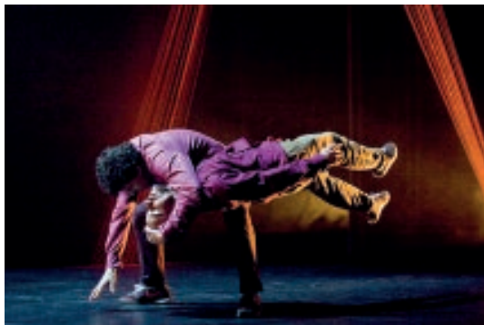
Ertza dantza taldea