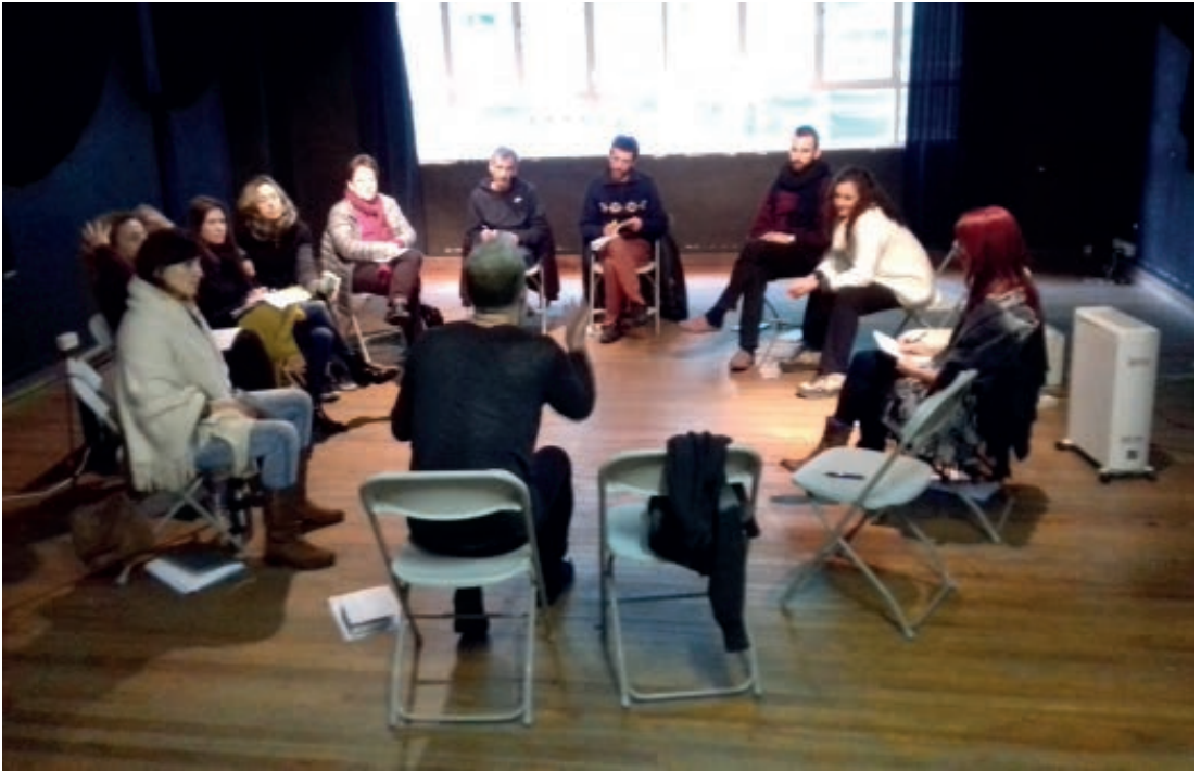
Participantes del curso